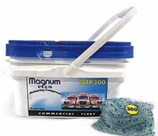
MT300 MT400 MT500

La legislación vigente prohíbe el uso de contrapesas de plomo en vehículos con un peso máximo autorizado inferior a 3500 kilos a excepción de las motocicletas. Las contrapesas de plomo pueden usarse en motocicletas y en vehículos pesados. El hierro (Fe) puede ser usado en cualquier tipo de vehículos